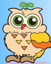
いなみ野学園イメージキャラクター いなみん