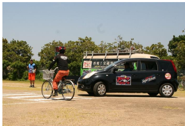
【スケアードストレイト（模擬交通事故）見学】