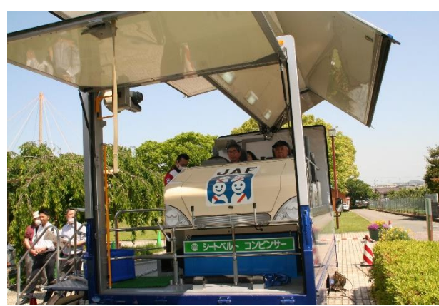
【シートベルトコンビンサ体験】