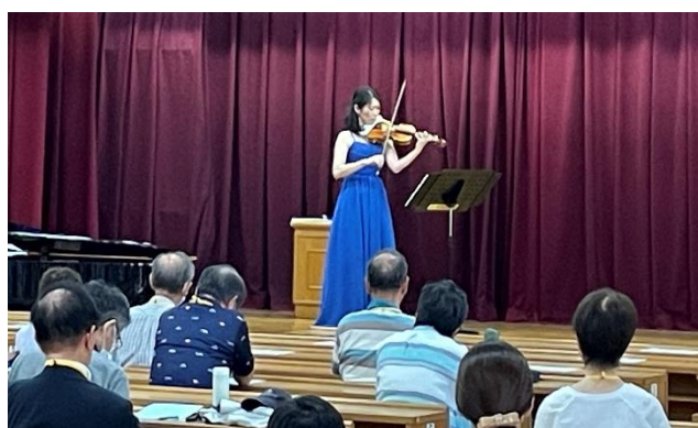
【7/29 ヴァイオリンの名曲】