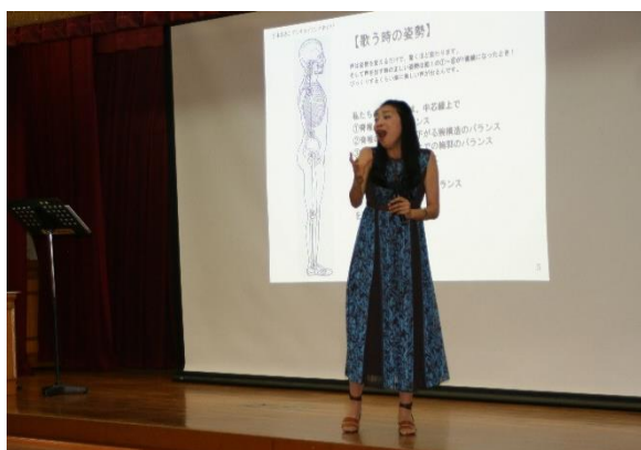
【7/30 ボイストレーニング】