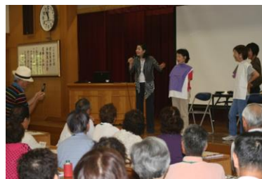
新しい発見がある講座風景