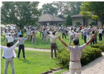
朝の体操でさわやかな1日のスタート