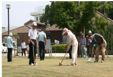
クラブ活動を芝生広場で元気にプレイ