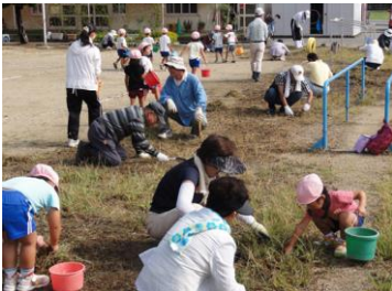
ボランティア活動 園児とともに