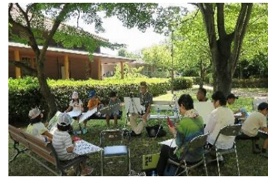
園内 緑の中で絵画を楽しむ