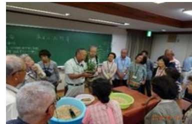
野草の話に聞き入る学生